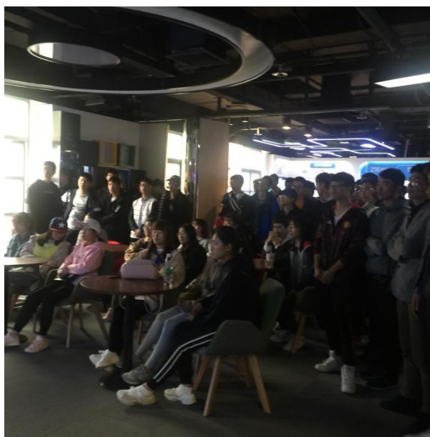
学生参观中兴行业创新开放实验室