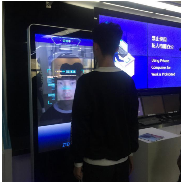
学生体验人脸识别技术