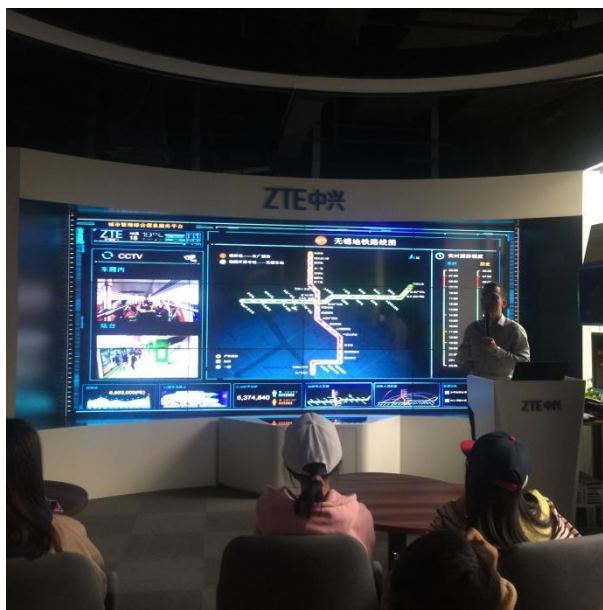
学生参观中兴行业创新开放实验室