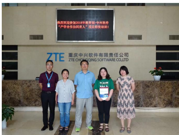
江苏海事学院教师参加中兴师资培训