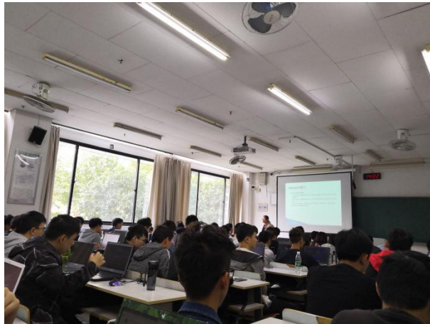
企业项目经理高校授课

在课程教学中，企业嵌入的专业基础与技术理论课程由企业高级工程师独立授课；企业嵌入的实训项目则实施“双师双排”，由企业派出的工程技术人员为主、校方的专业教师为辅的方式开展教学，确保嵌入课程的教学效果，同时在教学开展的过程中，有利于校方教师与企业工程技术人员的深入交流，相互之间取长补短，提升教学技能。