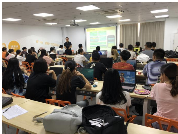
学生企业真实环境项目实习实训