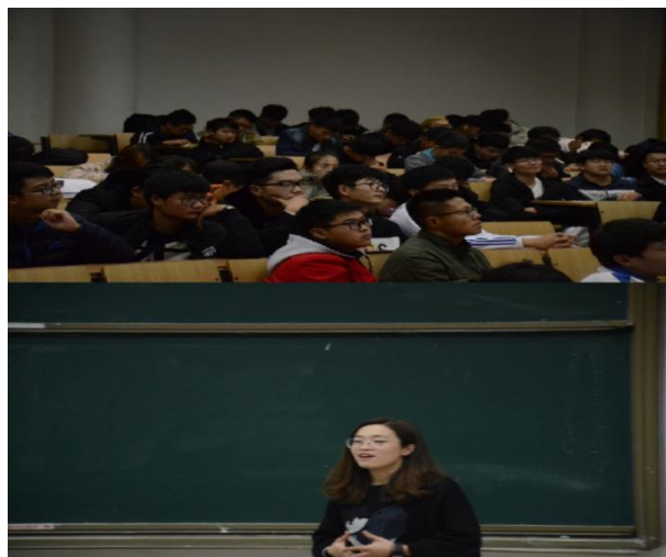
中兴班主任开企业班会课

基于嵌入式合作培养的特点，为加强班级的日常管理，进一步提升学生对合作企业的认同感，在日常管理方面，采取“双班主任”制，即学校配备一位班主任，负责学生的日常管理；企业配备一位班主任，协调班级中校企合作的各项事务，适当在班级活动中融入企业元素，开展学生的职业素质拓展训练等。经过一学期的实践，收到了良好的效果，该校企合作班的学生对合作方式及企业的认同感普遍较强。