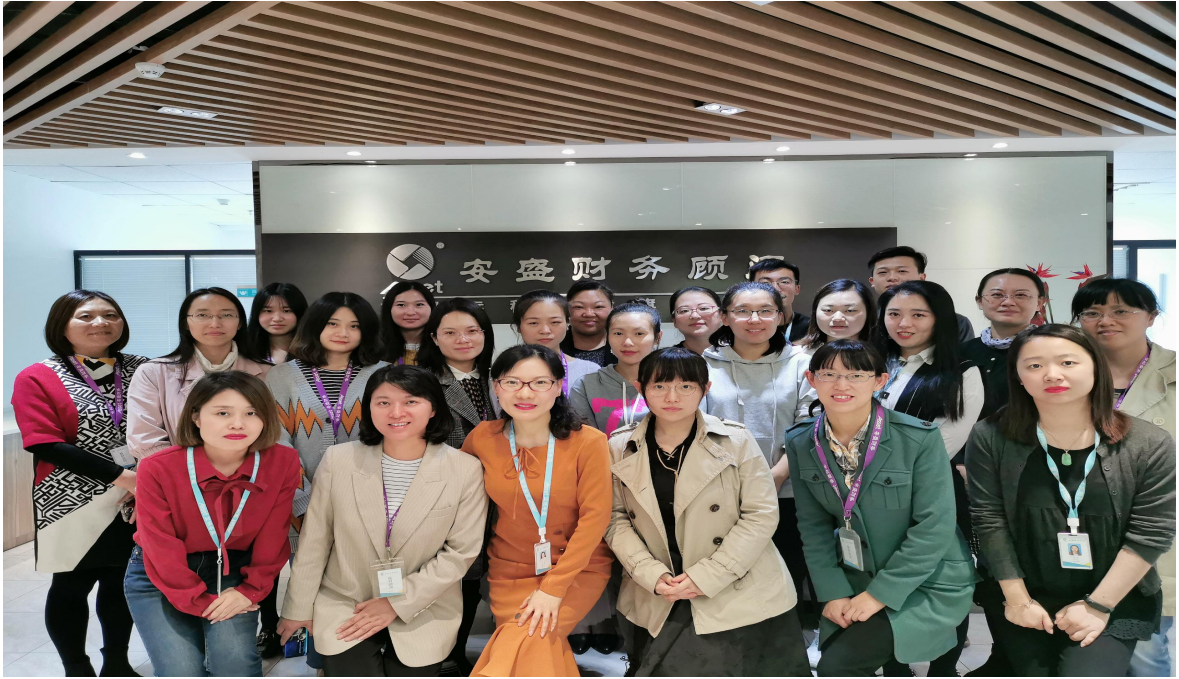
图4 学生赴企业参观、实践