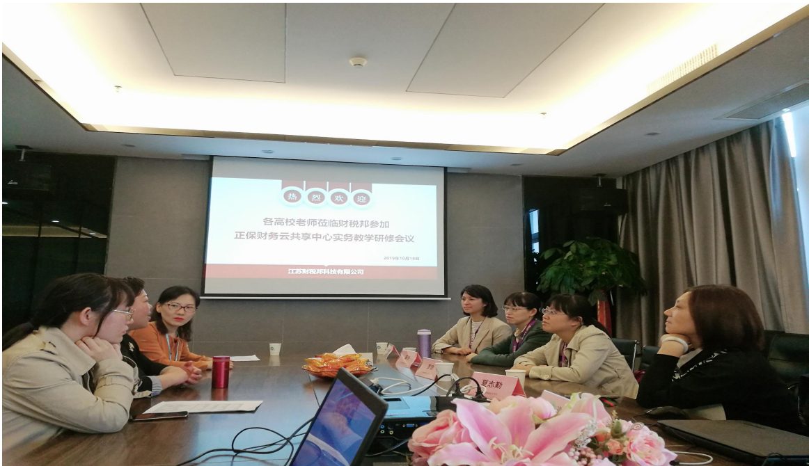
图2 校企双方专业研讨