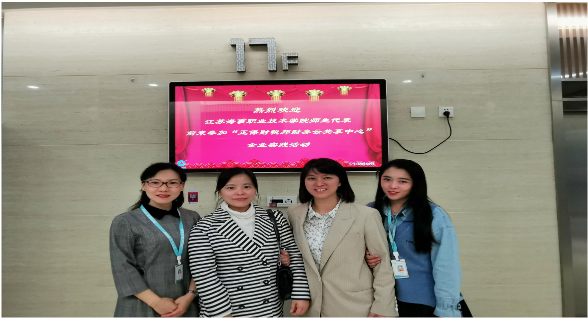
图1 教师和学生去企业调研