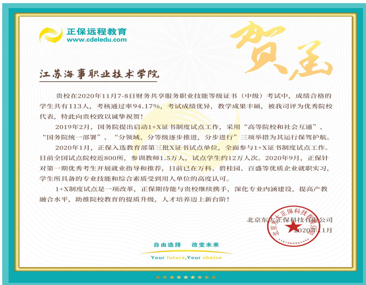
图3 1+X 培训受到好评

此外，校企共同参与会计专业 200 多名学生顶岗实习的教学，组织 2020 级新生参观正保财税邦财务云共享中心、安盛财务顾问公司。企业技术人员来校举办专业技术讲座 4 次。企业技术人员来校上课 6 人。