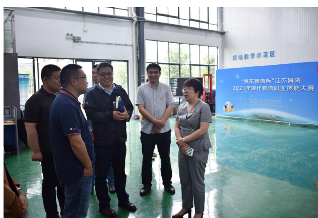
图11 校企双方交流下一步合作