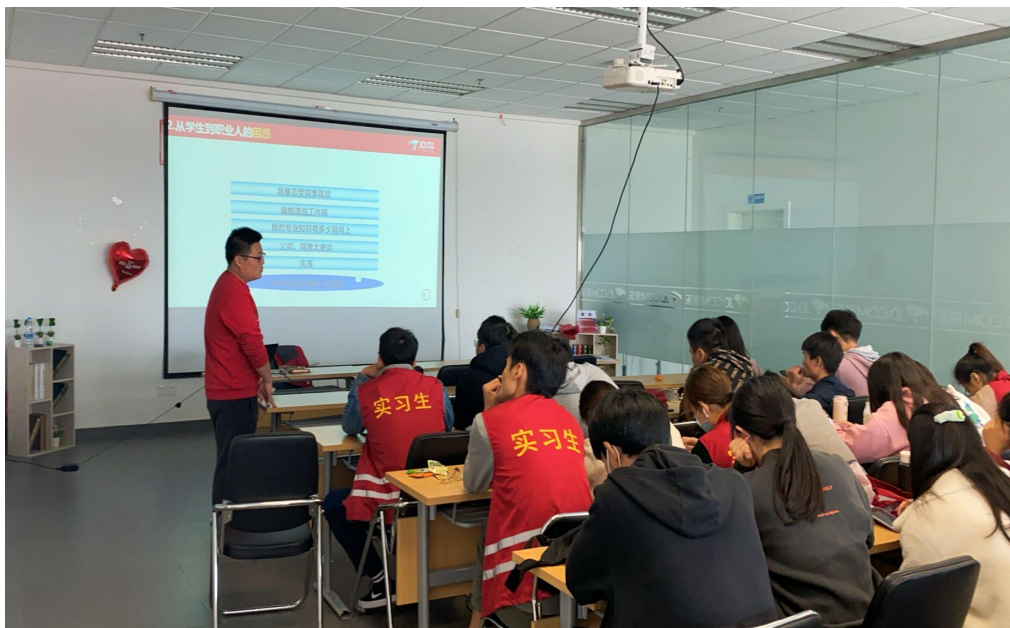
图4 企业教师在企业教室授课