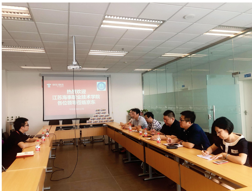
图 1 校企双方开展专业建设座谈

基于校企合作的原则，京东物流为现代物流管理专业学生提供专业认知与实践实习场所，指导学生了解专业技能和素养要求。企业专家多次参与专业建设座谈，在人才培养目标和规格定位、课程体系和知识技能培训体系机制的构建两方面从行业企业和用人单位视角提出许多切实可行的指导意见和建议，为提高学生培养质量提供了有力保障。校企双方共建共管实训实习基地，互相挂牌成立了“京东物流·物流人才培养基地”及“江苏海事职业技术学院实习基地。”