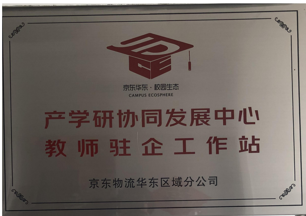
图5 校企合作成立教师驻企工作站