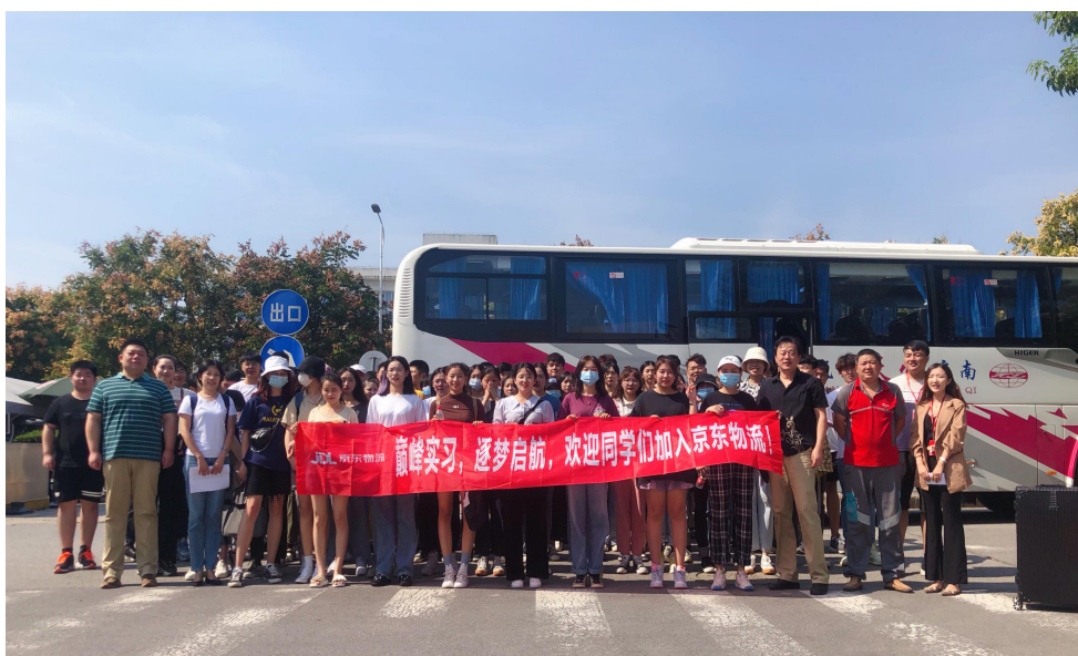
图6 2018级学生赴京东物流开展现代学徒制

织现代学徒制班级的教学、岗位轮训和考核评价，并实行“双导师制”进行日常管理。实习期间，以“师带徒”的形式开展，学生进入乙方实习时，实行师徒对接，举行拜师仪式，实习实训的期间由乙方师傅和甲方专业老师共同指导与管理，学徒需严格遵守企业规章制度，培养企业员工意识。2020年，2018级现代物流管理专业142名学生赴京东物流进行现代学徒制跟岗实习，实践技能和综合能力都大为提升，企业技术人员举办专题培训5次。