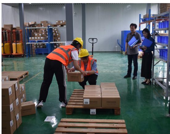
图10 比赛现场校企共同执裁