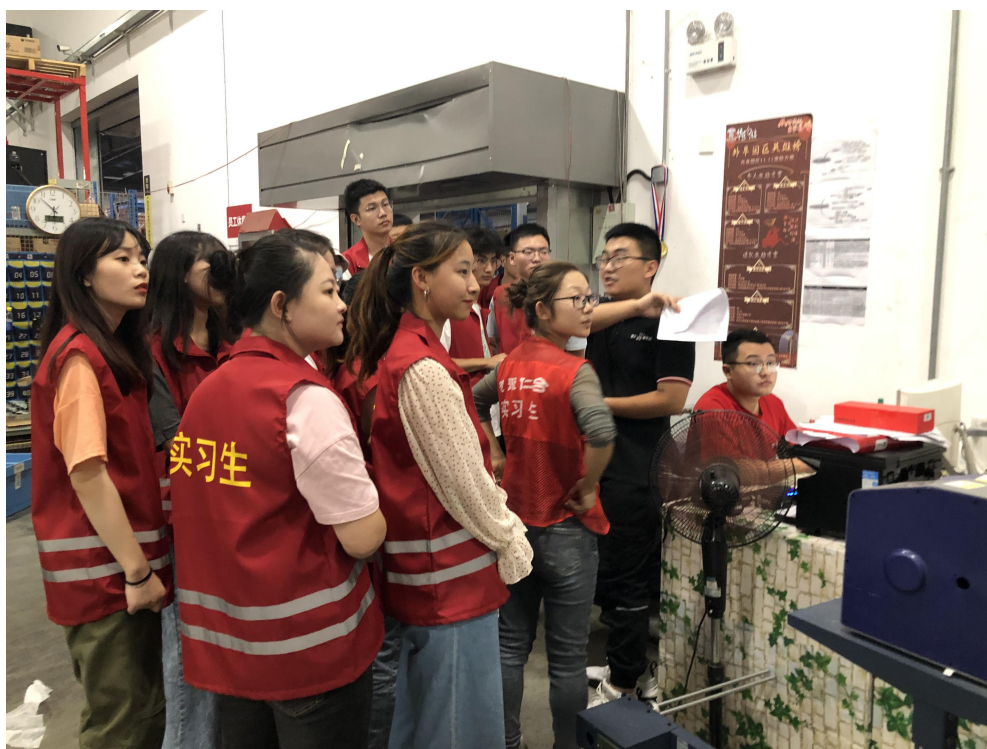
图3 企业教师在生产现场授课

京东物流派遣经验丰富的技术人员作为学校校外兼职教师，与现代物流管理专业专任教师一起共同建立校企混编师资队伍，在校内校外双课堂、教室与实践场所双场地开展各项教学活动。行业企业专家的现身说法与校内专职教师的理论指导相互融通、相得益彰，双方共同授课，极大提高了学生的学习热情。双方合作建立产学研协同发展中心教师驻企工作站，为校内专任教师开展企业实践提供支撑，促进校内教师不断提升实践能力。