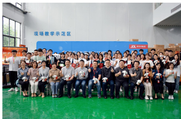
图9 校企双方、参赛选手合影