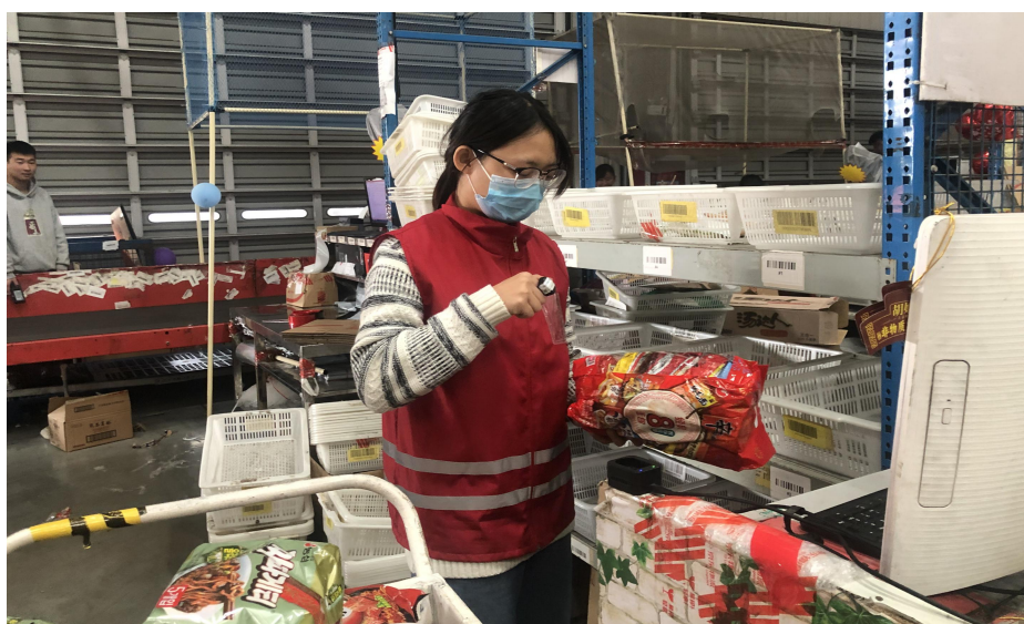
图7 学徒制学生在岗位实践