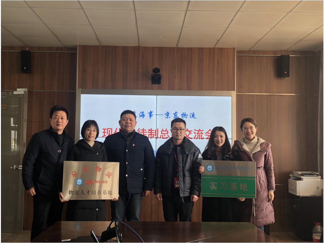
图 2 校企双方互相授牌共建实习基地