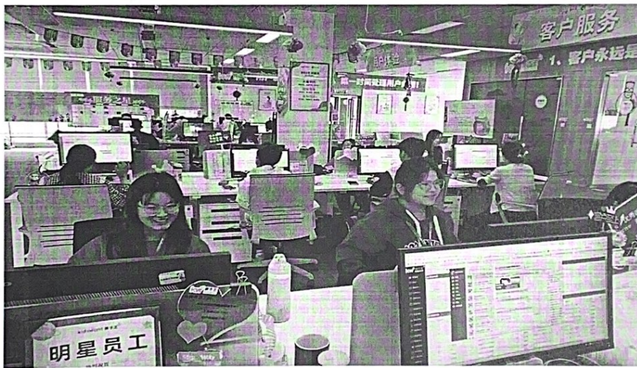
图2 电子商务专业学生参加企业跟岗实习现场