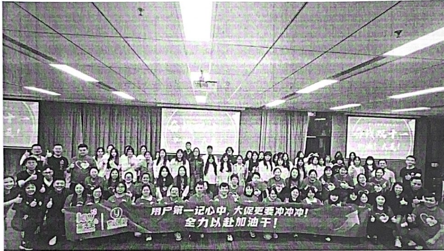
图1 2023年度孩子王顾客满意中心动员大会师生员工合影